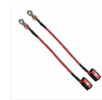
Tali M-Elastis 600

Tali dasar yang membantu dalam latihan . Pengguna dapat memegang tangannya dengan atau menggantungkannya kakinya