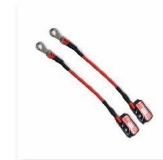
Tali M-Elastis 300

Membantu pengguna untuk mengetahui titik latihan yang tepat. Dengan elastisitas, berguna ketika pengguna melakukan latihan ketahanan