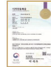
Patent Terdaftar dari Desain

Raphael 606 - PR adalah meja Leander Korea pertama yang dikembangkan di Amerika Serikat melalui kontrak lisensi. Hal ini ditingkatkan dengan studi klinis dari dokter dan inovasi teknologi YOUNG IL M.