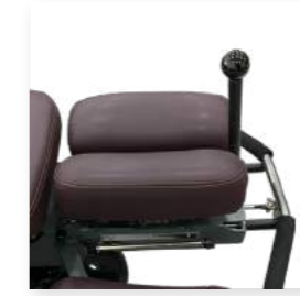
Pegangan Fleksi Manual

Tingkatkan efek fleksi dengan memperbaiki pinggang