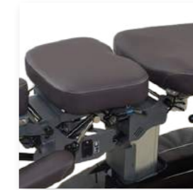
Drop Otomatis Maju Tengah

Teknologi Center-Forwardverticaldrop yang dipatenkan YOUNGILM diterapkan