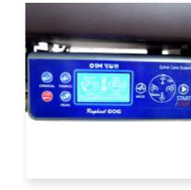
Panel Kontrol Elektronik Terintegrasi

Pembungkakan lateral kiri dan kanan dimungkinkan melalui batang fleksi