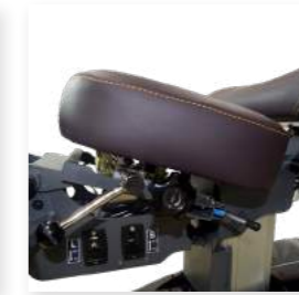
Bantal perut dapat disesuaikan

Teknologi Center-Forwardverticaldrop yang dipatenkan YOUNGILM diterapkan